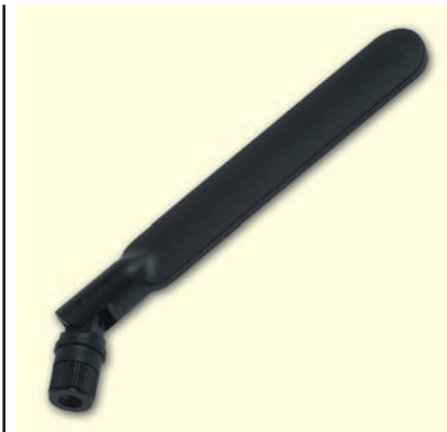
Рисунок 2 W1043 — внешняя двухдиапазонная антенна 2.4/5 ГГц