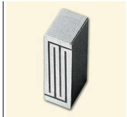
Рисунок 3 W3024 — керамическая MediaFLO антенна 719 МГц

Антенны компании Pulse для DVB-H, MediaFLO и DMB-S представляют собой настолько тонкие и крошечные изделия, что приложения мобильного ТВ просто реализованы в карманных устройствах. Антенны показывают отличные результаты работы и отвечают стандартам