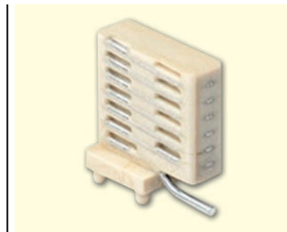
Рисунок 4 W3118A — вертикальная спиральная RX разнесенная антенна 850 МГц

По сравнению с разнесенными антеннами с воздушной изоляцией, керамические разнесенные антенны Pulse могут