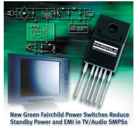
New Green Fairchild Power Switches Reduce Standby Power and EMI in TV/Audio SMPSs