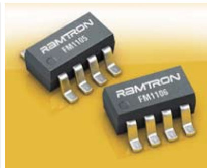
Рисунок 2 Внешний вид энергонезависимых триггеров Ramtron в корпусе SOT23-8

реле или переключателя. При нормальной работе системы, триггер контролирует работу реле. В случае сбоя в линии питания, триггер запоминает последнее состояние реле и мгновенно, автоматически восстанавливает его после восстановления работы системы.